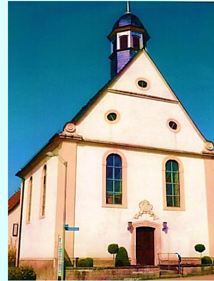
Ev. Gottesdienste Grombach