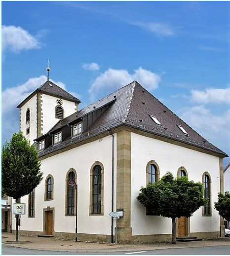
Ev. Gottesdienste Ehrstädt

Sa. 17. Dez. 17 Uhr 4. Advent Singen unterm Weihnachtsbaum